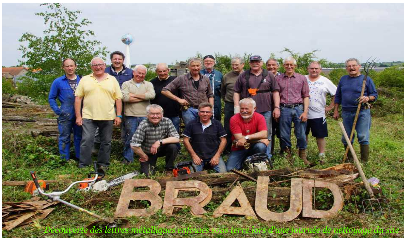
Découverte des lettres métalliques enfouies sous terre lors d'une journée de nettoyage du site

Ci-après, un petit reportage photo vous est proposé sur l'avancée des acquisitions et le démarrage des travaux pour le futur musée Braud.