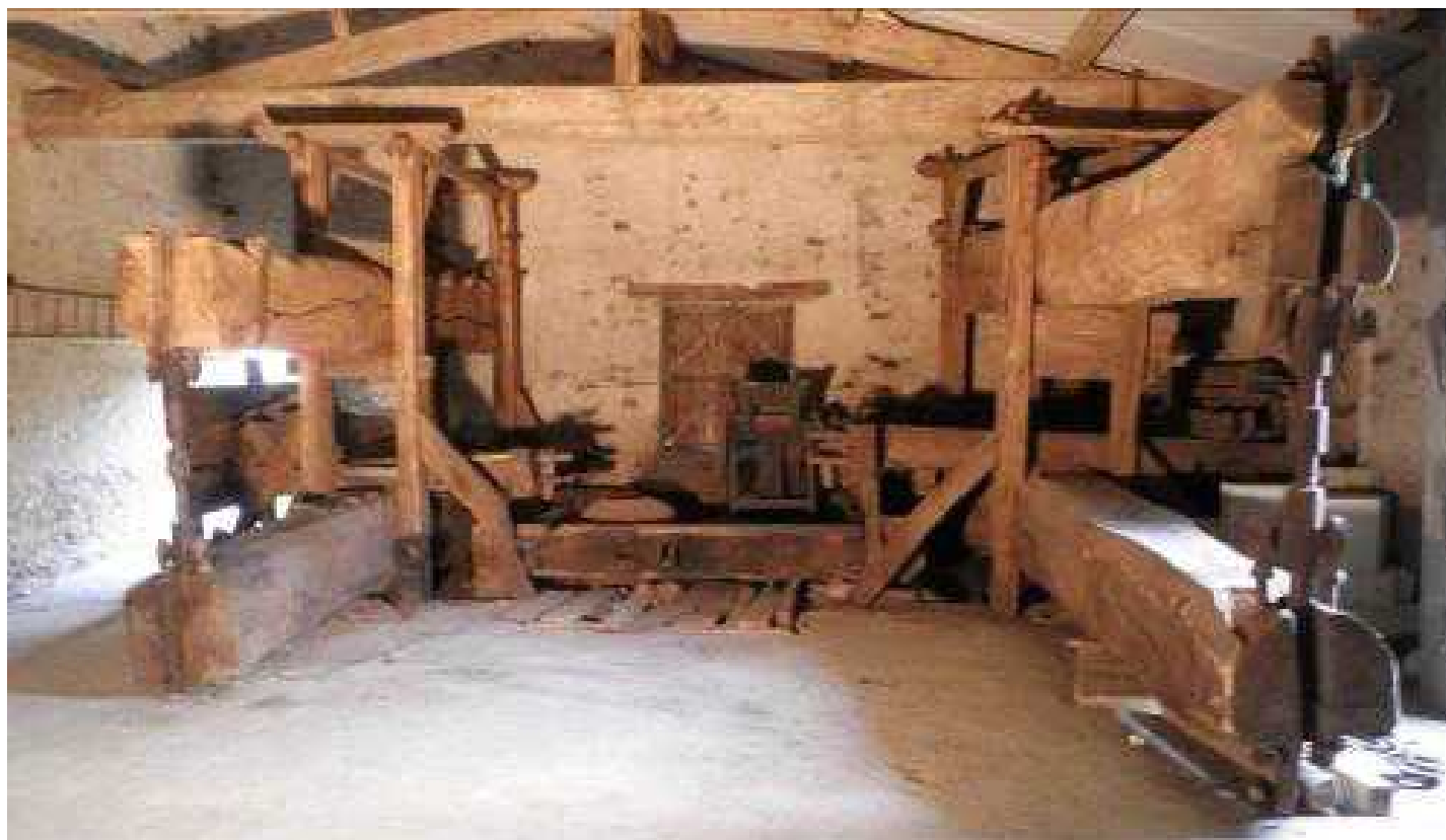
Les pressoirs de la Dîmerie à la Chapelle Basse-Mer (Divatte-sur-Loire). « Les pressoirs anciens du Vignoble Nantais »

Chaque article présente un aspect du territoire d'hier ou d'aujourd'hui autour de 5 parcours. Le premier chapitre est une promenade « Au fil des siècles », de la préhistoire à la première guerre mondiale.