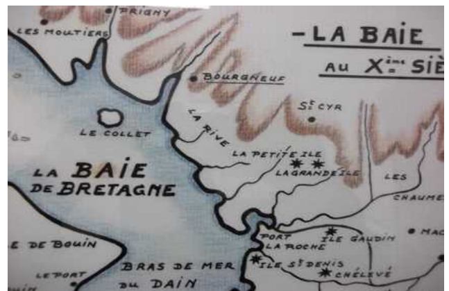
Une carte de la Baie de Bourgneuf au X e siècle