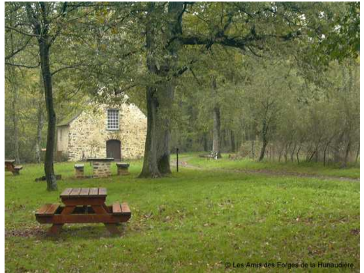
La Chapelle des Forges de la Hunaudière à découvrir lors de la visite du site avec les bénévoles.

Des bénévoles réalisent des moules devant vous avec les gestes d'antan et répondent à toutes vos questions pour vous expliquer cette technique.