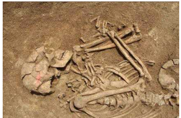
Une découverte exceptionnelle. « Vivre et mourir aux Cléons : quand l'archéologie révèle 10 000ans d'occupation à Haute-Goulaine »

l'actualité viticole sont une nouvelle fois abordés, avec des approches différentes et complémentaires à celles du tome 1. Cependant de nouvelles thématiques apparaissent comme l'archéologie ou l'art contemporain qui ouvrent de nouveaux regards.