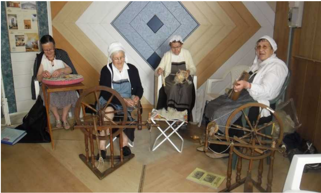
Les dentellières du village en action lors de la Journée du Patrimoine de Pays et des Moulins

L'association Saint-Père Histoire a été créée en 2007, en accord avec la mairie de Saint-Père en Retz. Elle est une antenne de la Société des Historiens du Pays de Retz, avec laquelle elle a passé une convention.