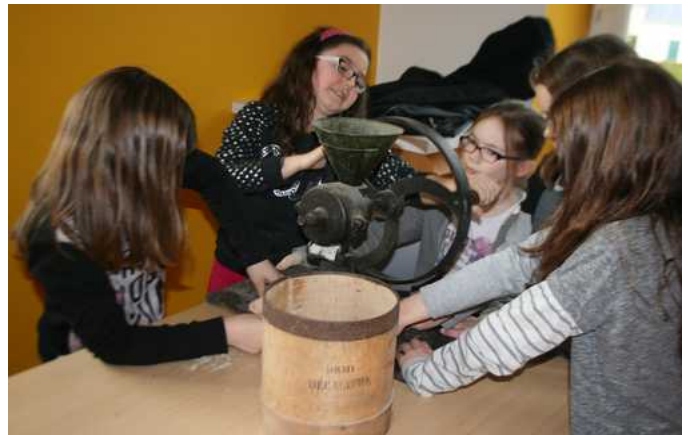
Le broyage du blé à la main

Au Moulin neuf, la fabrication de farine de blé noir se fait en direct sous les yeux des écoliers déjà imprégnés de l'imaginaire de la meunerie, écoliers invités par la suite à investir la minoterie voisine, puis à « se retrousser les manches » pour activer la meule de pierre et tamiser la mouture.