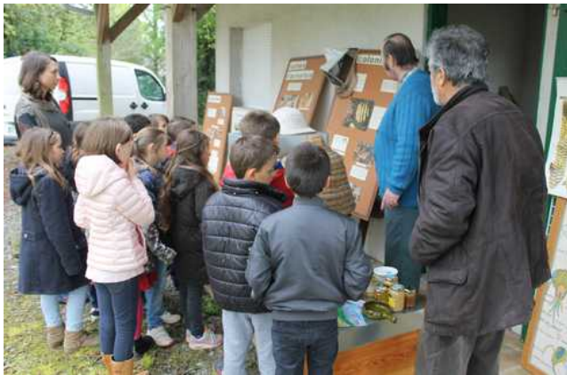
L'apiculture expliquée à des jeunes écoliers

Cette jeune génération est sensibilisée au patrimoine rural et agricole, et invitée à l'apprentissage des savoir-faire. L'Ecomusée rural entend bien continuer à développer cette politique. Ce travail envers les jeunes générations permet d'établir et de consolider le fil conducteur de la mémoire.