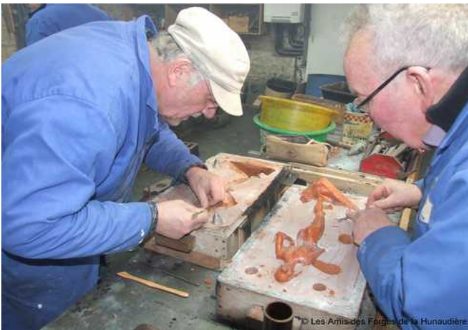
Les bénévoles de l'association des Forges de la Hunaudière en train de sculpter.

Aujourd'hui, notre association fait revivre le site en organisant des visites guidées pour les groupes, les scolaires et une animation l'art de la fonderie qui fonctionne du début avril jusqu'au 15 novembre et pendant les vacances scolaires d'hiver (4 semaines).