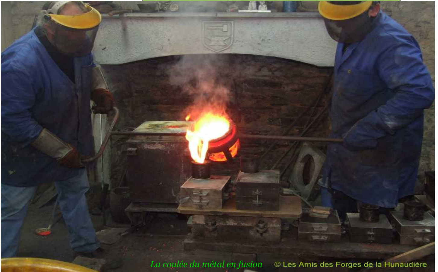
La coulée du métal en fusion

en fonte et en fer. Pour les forges de la Hunaudière, 150 hectares de bois de 20 ans seront coupés chaque année et transformés en charbon de bois.