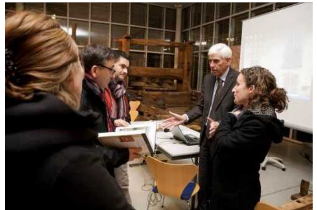
Une conférence de l'Université sur Lie en 2013 : des débats qui se poursuivent.

L'architecture, ou encore le paysage, les aménagements des cours d'eau, et