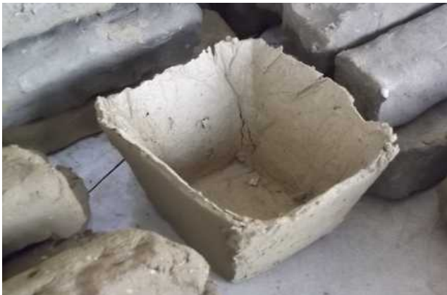
Un auget à sel reconstitué

Vous pouvez déjà observer l'avancement de notre projet pédagogique 2016, unique dans le département et la région, qui est la reconstitution d'un «four à augets» de l'époque gauloise. Ce travail s'effectue dans une salle spécialement dédiée au sujet, où se trouve une magnifique fresque en rapport provenant du Musée départemental Dobrée de Nantes. Vous trouverez également des maquettes, pièces archéologiques et divers supports permettant de comprendre l'ingéniosité de nos ancêtres pour produire du sel avant la création de nos marais salants !