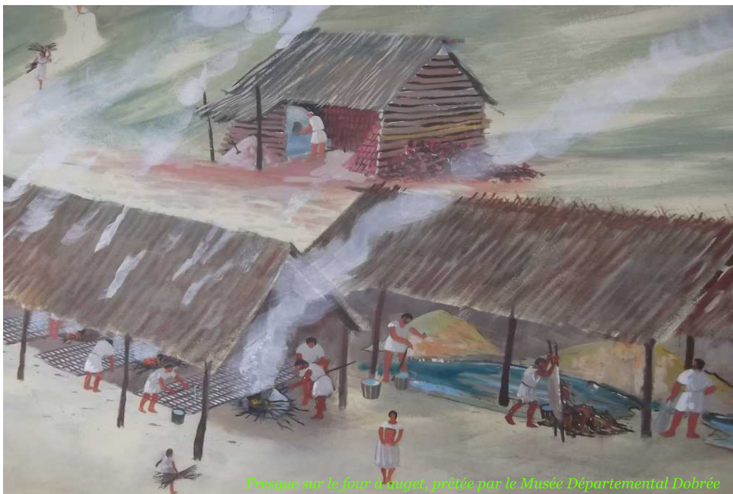
Fresque sur le four à suget, prêtée par le Musée Départemental Dobrée

Le Musée du PAYS DE RETZ, géré par l'Association «les Amis du Pays de Retz», étoffe son rôle de lieu et d'outil de découverte de l'histoire, du patrimoine et des traditions du territoire.