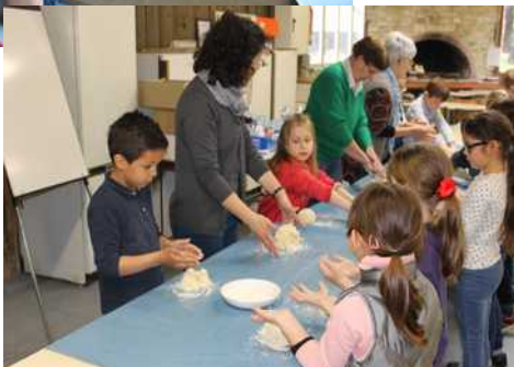
Quelques ateliers : fabrication de bougie à la cire d'abeille et fabrication du pain.

Un goûter accompagne toujours ces ateliers pour lesquels l'Ecomusée rural fournit matériaux, ustensiles et outils.