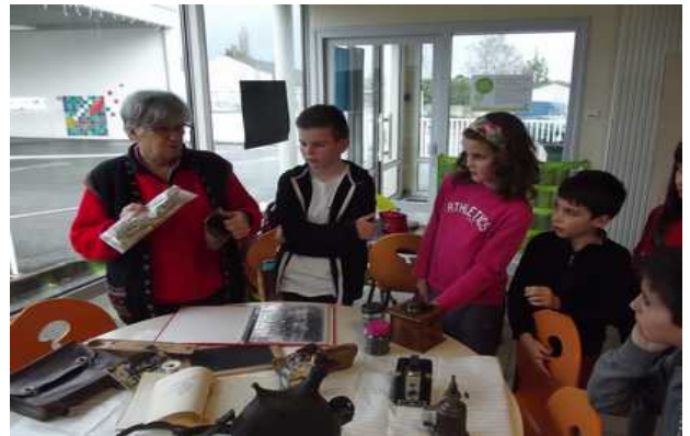
Atelier d'écriture à l'ancienne

Des animations ponctuelles sont réservées aux enfants et aux jeunes, toujours mises en place avec un souci pédagogique qui privilégie l'attention, la réflexion, l'adresse manuelle : chasse aux œufs au printemps sous la forme de réponse à des énigmes ; concours d'épouvantails en juillet ; animations autour de la citrouille à l'époque de la fête d'Halloween.