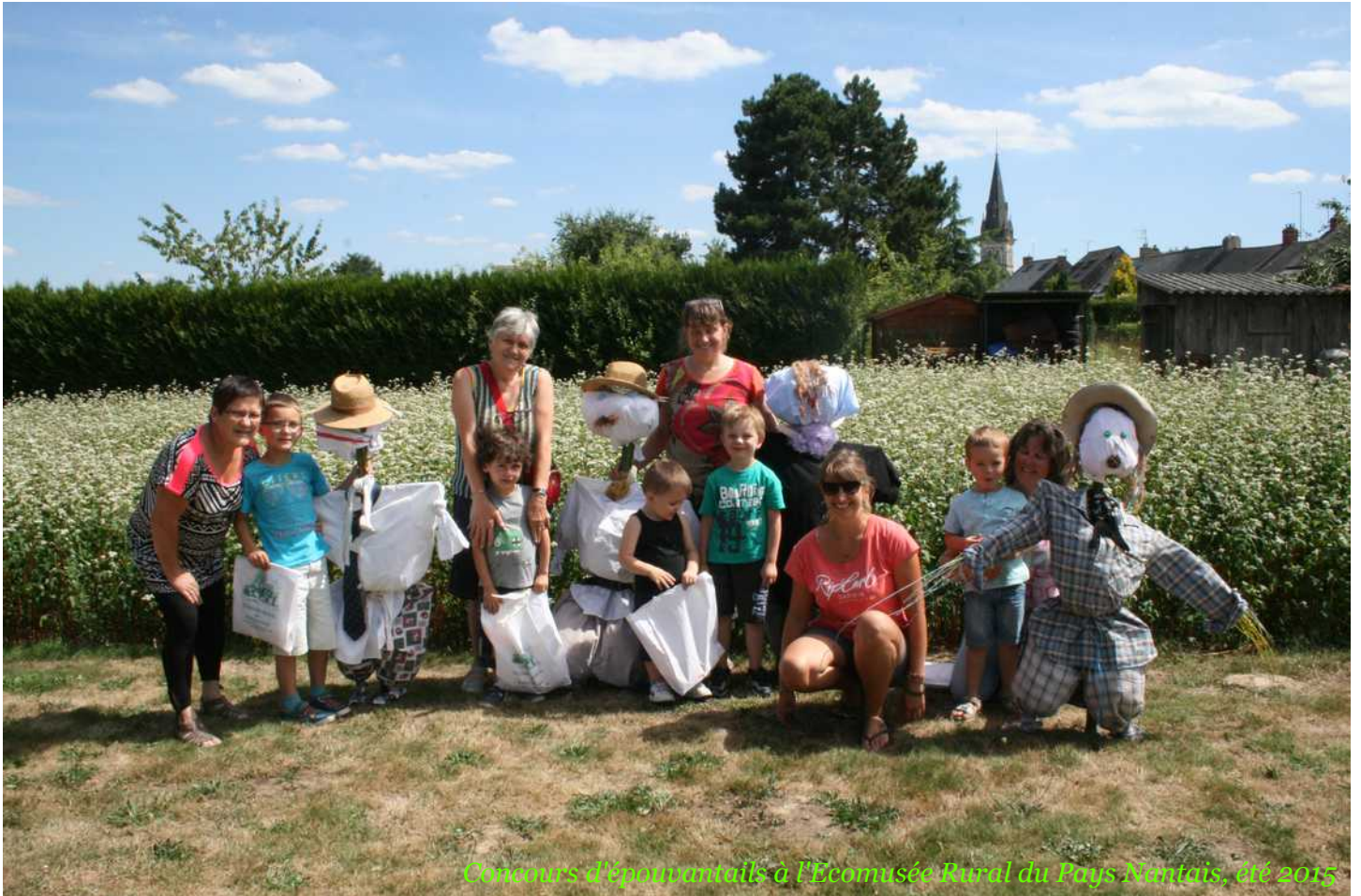
Concours d'apajournaux à l'Ecomusée Rural du Pays Nantais, été 2015

L'Ecomusée rural du Pays nantais accueille plus de 5000 visiteurs sur ses deux sites, la ferme de la Paquelais et le Moulin neuf à Vigneux-de-Bretagne. Affluence des grandes fêtes ou groupes plus restreints, ce public se partage entre diverses catégories, qu'il s'agisse d'enfants et de scolaires, de randonneurs, de membres d'associations, de cyclistes, de personnes âgées, de cavaliers, de personnes atteintes d'un handicap, ou de touristes de passage.