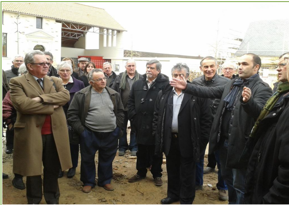
Nos adhérents, tous bien attentifs, lors de la visite du chantier des bâtiments en cours de restauration aux Renaudières