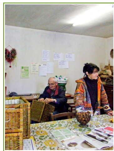
Journée Portes Ouvertes à la Maison de la Ruralité

Les ateliers menuiserie et peinture sur bois seront présents à la Foire de Béré en septembre 2013. L'association organise également une journée portes ouvertes le dimanche 29 septembre de 10h à 18h où à l'occasion tous les savoir-faire des bénévoles vous seront montrés. Une vente des objets réalisés par les adhérents sera prévue ce jour.