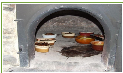
Quelques plats en train de cuire dans le four à pain rénové.

Ils viennent de créer un atelier apiculture et remettent en route l'atelier cuisine pour tous les amateurs cuisiniers, gourmands...Au fil des saisons sont ainsi fabriqués confitures, cidre, et meubles en cartons...Sans oublier le pain ou diverses fabrications cuits dans un four à pain du 18ème siècle entièrement rénové par les adhérents.