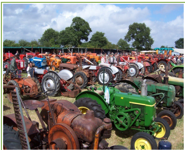
Exposition de tracteurs de l'association lors de la fête traditionnelle à Frossay