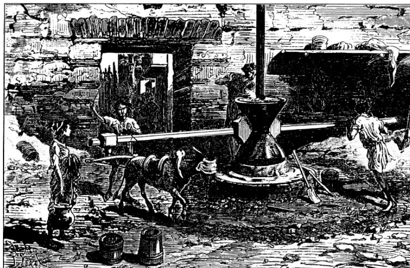
Moulin à blé chez les Romains

Remontant encore plus loin vers les origines de l'humanité, on débouche alors sur la philosophie : selon François Sigaut, l'homme s'est fait lui-même à travers le geste technique et l'invention des outils. L'espèce humaine n'est qu'une espèce animale d'abord un peu plus douée que les autres dans le maniement des outils : le processus d'hominisation est lié au développement de l'action outillée 3 .