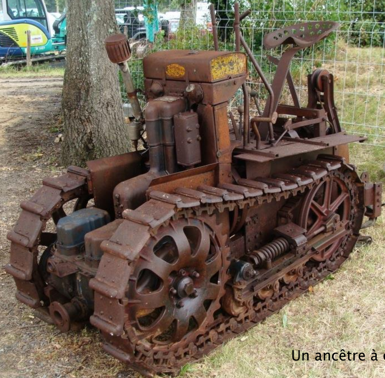
Un ancêtre à chenilles