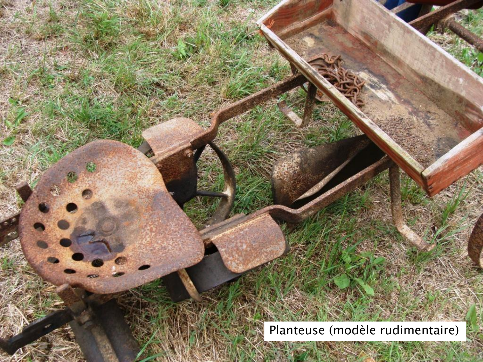
Planteuse (modèle rudimentaire)