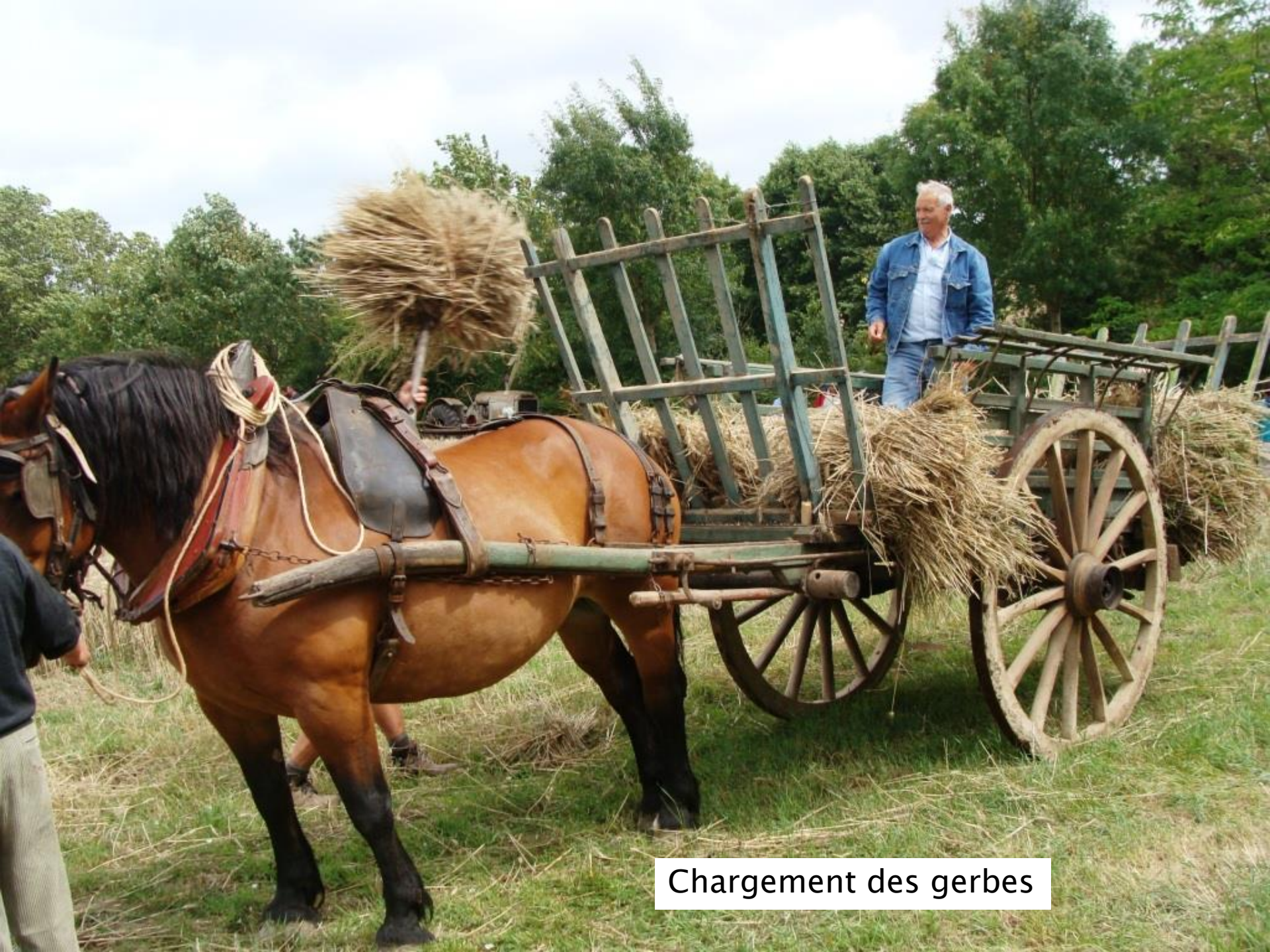
Chargement des gerbes