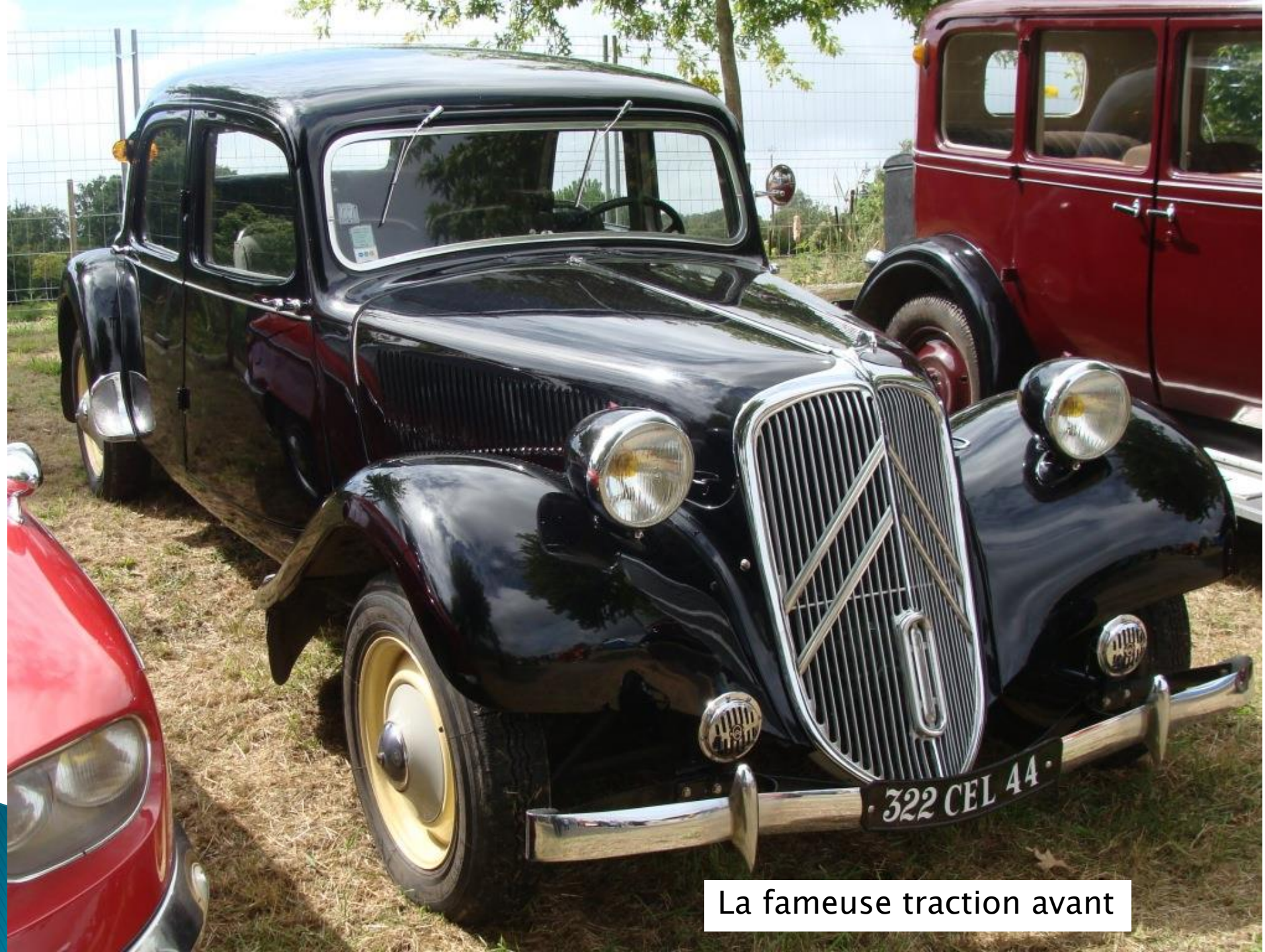
La fameuse traction avant