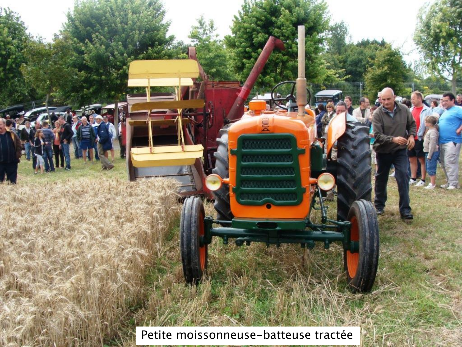
Petite moissonneuse-batteuse tractée